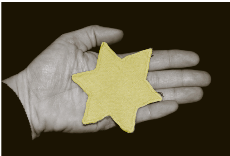
Originalna židovska zvijezda iz vremena Holokausta, vlasništvo obitelji Schwarz

Ispričajte mi kako su vas odveli, vas i ostale međimurske Židove između 26. i 28. travnja 1944? Možete li se sjetiti detalja?